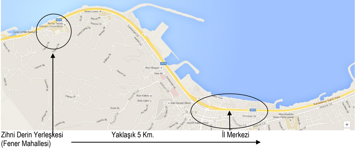
Harita 1: RTEÜ Zihni Derin Yerleşkesi

ADRES: Recep Tayyip Erdoğan Üniversitesi, Spor Bilimleri Fakültesi, Zihni Derin Yerleşkesi, 53100, Fener Mahallesi, Merkez/RİZE