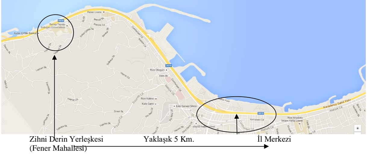
Harita 1: RTEÜ Zihni Derin Yerleşkesi

ADRES: Recep Tayyip Erdoğan Üniversitesi, Spor Bilimleri Fakültesi, Zihni Derin Yerleşkesi, 53100, Fener Mahallesi, Merkez/RİZE